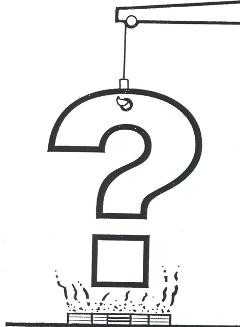
JAK BUDE VYPADAT NOVÁ ???